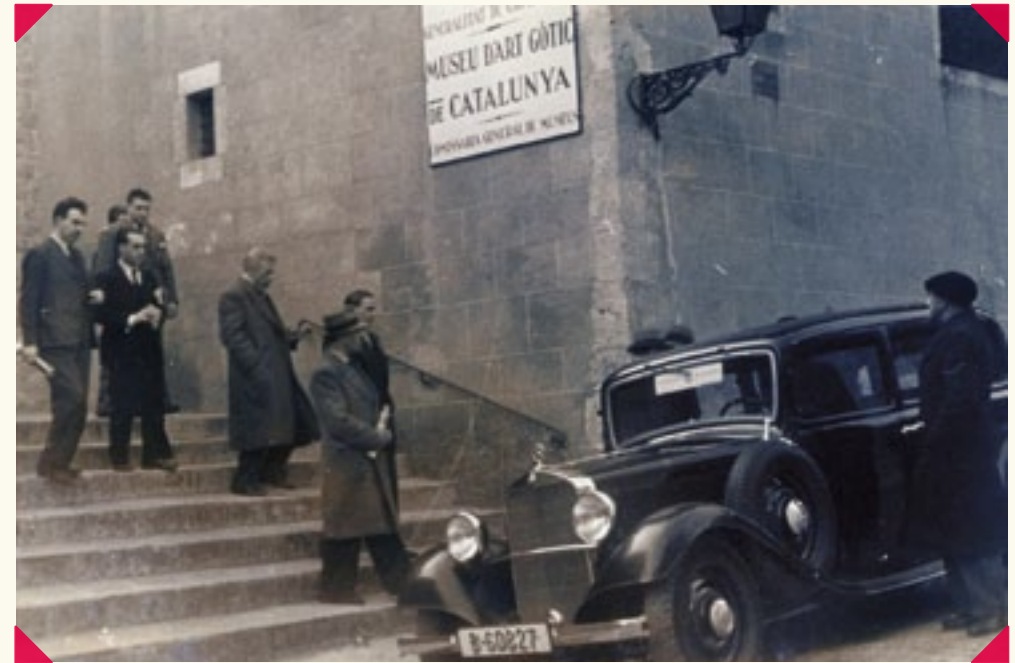
Visita oficial de representants de la Generalitat de Catalunya al Museu d'Art Gòtic de Catalunya, a la sortida del museu. 1936-1938.