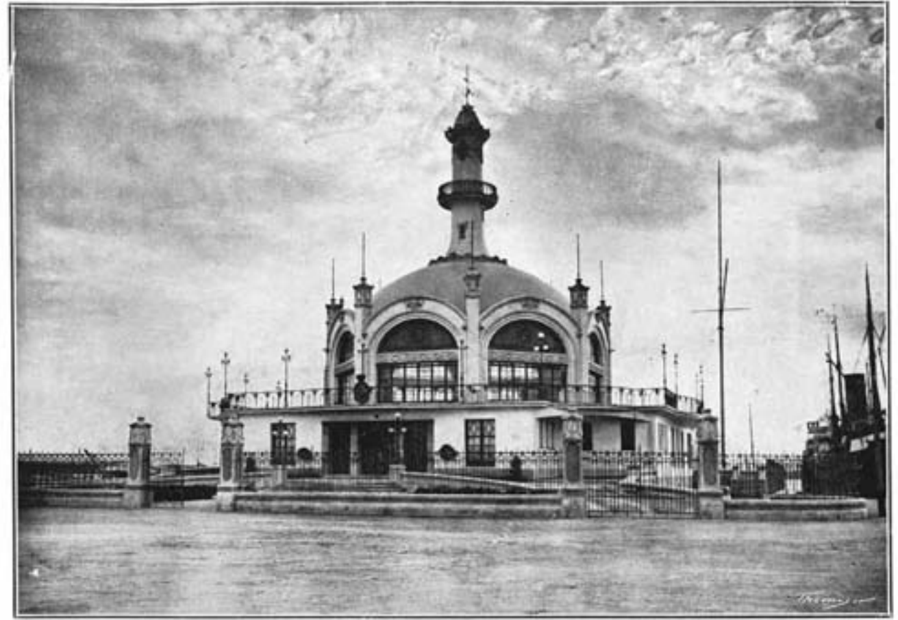
Real Club Marítimo Royal Club Maritime